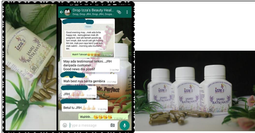
Caption : produk dan testimoni