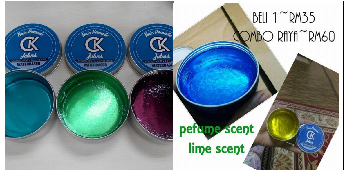
Caption : produk